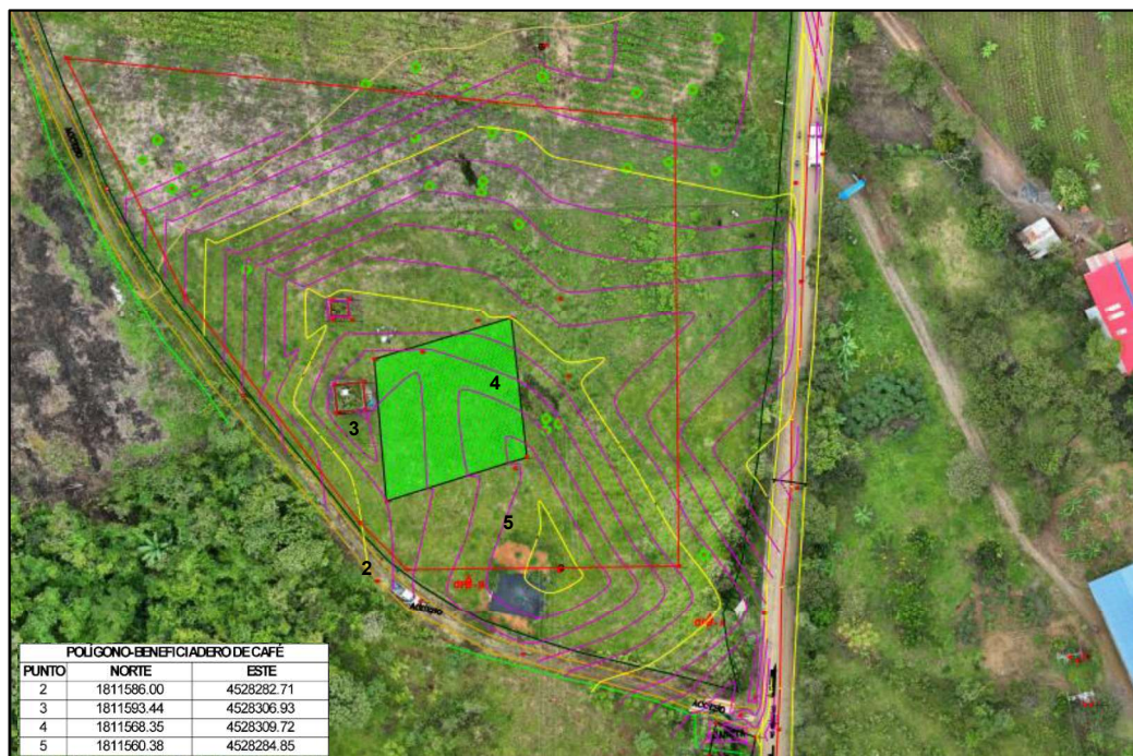
Imagen 1. Ubicación del Centro de acopio y transformación de café

En el marco de la ejecución del Memorando de Acuerdo 467/2024 suscrito entre la Oficina de las Naciones Unidas Contra la Droga y el Delito – UNODC y la Cooperativa de Beneficiarios de La Reforma Agraria del Cauca - COOBRA , se ha identificado la necesidad de fortalecer la cadena de valor del café en el municipio de Argelia, Cauca, con el fin de mejorar la productividad y competitividad de los productores. Para ello, se requiere la realización de DISEÑO ARQUITECTONICO, DISEÑO ESTRUCTURAL, DISEÑO DE RED HIDROSANITARIA, ESTUDIOS ELECTRICOS DETALLADOS, DISEÑO DE PROCESOS AGROINDUSTRIALES (FLUJOGRAMA DE PROCESOS), REDES ESPECIALES Y PRESUPUESTO (APU's, memorias de cantidades de obra, programación de obra y especificaciones técnicas), todo esto para el diseño y construcción de un centro de acopio y transformación de café, cuya localización prevista es la vereda Mirolindo del municipio de Argelia, Cauca a 3,8 km aproximadamente del casco urbano.